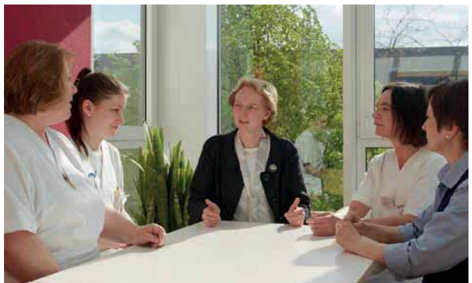
In regelmäßigen Sitzungen tauschen sich die Mitarbeiterinnen aus.

Bis heute sind die Diakonieschwestern sowohl am Bürgerhospital als auch am Clementine Kinderhospital Teil des Pflege- und Funktionsteams. Der diakonische Auftrag in der Patientenversorgung steht dabei noch immer mit der Gründungsphilosophie im Einklang. Eine nach christlichen und überkonfessionellen Grundsätzen ausge-